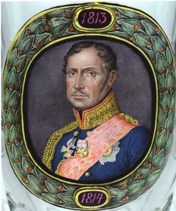
3 Pointillistisches Porträtdetail (Abbildung 4).