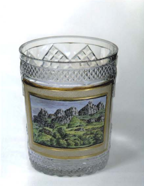
1 Zylindrischer Becher um 1820, Höhe 11,3 cm, Felsige Gebirgskette. Privatsammlung.