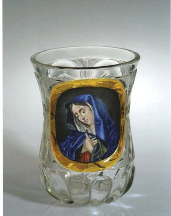
2 Glockenförmiger Becher um 1825/35, Höhe 12,2 cm, hl. Maria. Privatsammlung