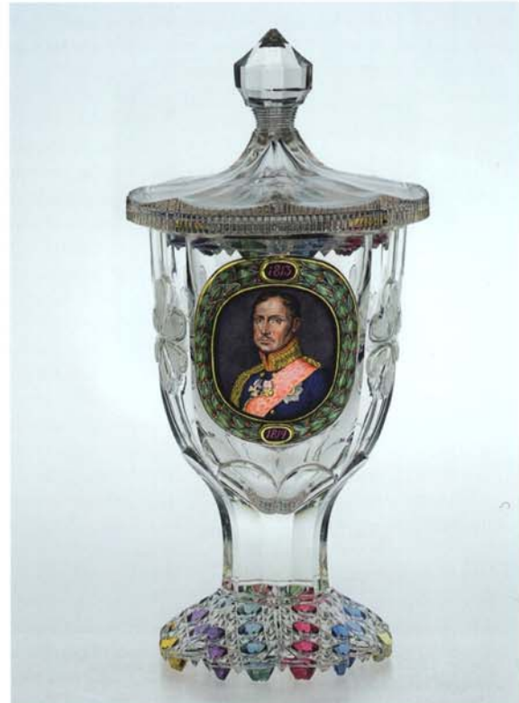
4 Deckelpokal datiert 1836, Höhe 25,0 cm, Porträt von Friedrich Wilhelm III. Kunstpalast Düsseldorf, Inv.Nr. 1940-187.