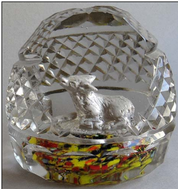
Abb. 2020/03-01 Briefbeschwerer mit eingeglaster Sulfide Rehkitz farbloses Glas, geschliffen Sammlung Annemarie und Gerd Mattes

Unter den Sammlern spätklassischer Briefbeschwerer aus Silesia / Bohemia sind die mit drei-dimensionalen Figuren beliebte Sammlerstücke. Peter von Brackel hat einige davon in seinem Buch „ Paperweights; Historicism, Art Nouveau, Art Deco; 1842 to Present “, Fußnote 1, Page 96-99, Picture 152-161, beschrieben und abgebildet.