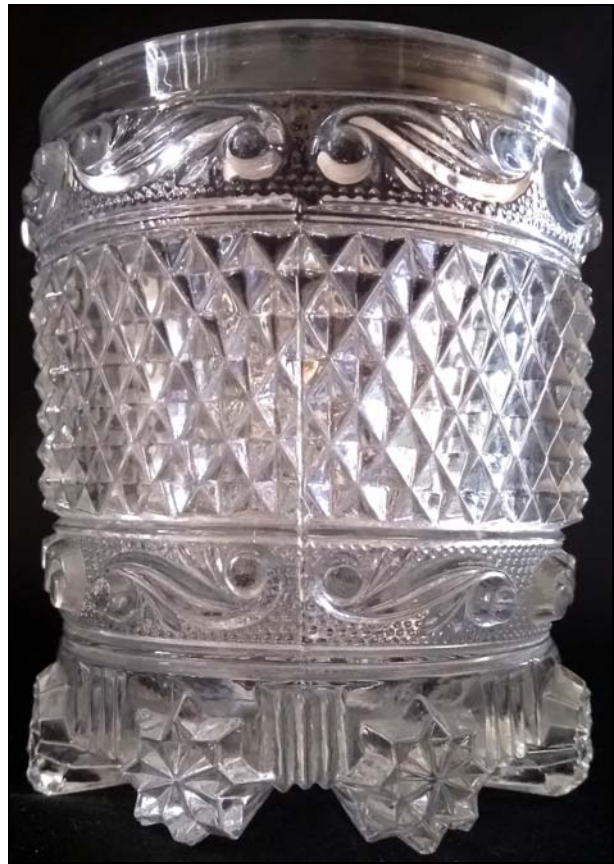
Abb. 2001-05/339 (Ausschnitt)

Becher / Gobelet m. à bandeau de diamants et sablé Hersteller unbekannt, Baccarat oder St. Louis, ab 1830 ... MB LH um 1840, Planche 12, No. 1034 (2) [Größen]