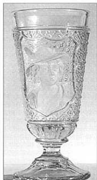
Pohár, „dívka s kloboukem“ v erbu, matováno, zbytky pozlacení, čiré sklo se zřetelným hnědým nádechem, výška 16,8 cm, průměr 7,8 cm, sbírka Geiselberger a Billek, pravděpodobně S. Reich & Co., okolo roku 1880, bez značky, viz Sellner 1986, kat. č. 123 pohár s jinochem, křišťál, výška 16,7 cm, St. Louis (?), 4. čtvrtina 19. století, bez značky, sbírka Reidel