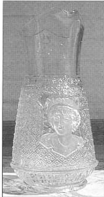
Velký džbán, „dívká s čepcem“ v erbů, matováno, čiré sklo s lehkým hnědým nádechem, foukán do formy a dále již tradičně zpracován, ucho připojeno (přilepeno) za tepla, výška 30 cm, průměr 15,5 cm, sbírka Geiselberger, pravděpodobně S. Reich & Co., okolo roku 1880, bez značky, srv. Adlerová 1972, kat. č. 98