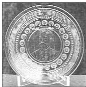
Pamětní talíř arcivévoda / korunní princ Rudolf v uniformě, bez nápisu, okraj bez oblouků, granulování, rozety, sbírka Stopfer, průměr 12,7 cm, podobizna není matovaná, pravděpodobně S. Reich & Co., okolo roku 1889, bez značky

jen malé množství informací o těchto lacinných lisovaných sklářských výrobcích. Velmi často byly tyto dokumenty, důležité pro dnešní sběratelskou činnost, zničeny. Jedná se především o nejrůznější ceníky a knihy vzorů. Jako příklad můžeme uvést východofrancouzské sklářské hutě Vallérysthal a Portieux, obě se dostaly do potíží a byly zrušeny.