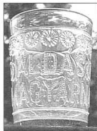
Pamětní pohár se znakem Uher, vavřínové větvičky a koruna, rozety, zadní strana, granulovaný nápis „ALDAS A MARGYARNAK“ (Požehnání Uhrám), sbírka Stopfer, čiré sklo, výška 10,7 cm, pravděpodobně S. Reich & Co., okolo roku 1890, bez značky

Problematikou industrializace sklářského průmyslu se v České republice zabývalo od roku 1972 jen několik málo vědců.