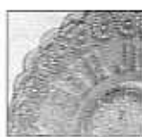
Detail okraje talíře

Některé ze sklařských výrobků, které pravděpodobně také vznikly, nebyly dosud nalezeny: existují výrobky s obrázkem císaře Františka Josefa I., jeho syna arcivévody Rudolfa (sebevražda 1889), následníka trůnu Františka Ferdinanda (zavražděn 1914), milované dcery Marie Valerie, ale žádné s portrétem císařovny Alžběty (zavražděna 1898).