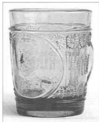
Pamětní pohár arcivévoda / korunní princ Rudolf v uniformě, granulovaný nápis „KRONPRINZ RUDOLF“, sbírka Stopfer a Geiselberger, modré lisované sklo, výška 7,7 cm, průměr 6,1 cm, pravděpodobně S. Reich & Co., okolo roku 1889, bez značky, srv. pamětní talíř „ELJEN A HAZA“

Z knih vzorů slavného obchodu ze sklem Launay, Hautin & Cie., Paříž, který prodával kolem roku 1850 lisované sklo skláren z Baccharatu a St. Louis, se do dnešních dob dochovalo pouze deset dílů. Doposud byly nalezeny pouze dvě knihy vzorů sklárny Meisenthal z Lotrinska a čtyři knihy vzorů sklárny Fenne ze Sárska! Kolem roku 1990 byly zrušeny některé velké sklárny ve východním Německu, došlo tedy i k zničení celé řady důležitých dokumentů.