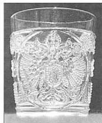
Pamětní pohár s rakouskou orlicí se znakem rakousko-uherské monarchie a korunou, rozety, přední strana, granulovaný nápis „KAISER - JUBILÄUM“, sbírka Stopfer, čiré sklo, výška 7,5 cm, pravděpodobně S. Reich & Co., bez značky, 1888 nebo 1898