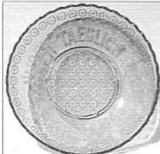
Talíř na maslo s rozetami, nápis tečkovaným písmem: „Naš denní chléb dej nám dnes“, světlemodré sklo, výška 4,5 cm, průměr 23 cm, sbírka Geiselberger a Billek, pravděpodobně S. Reich & Co., okolo roku 1880, bez značky

okolo roku 1888 a 1898. Tyto výrobky zcela jistě nebyly vyrobeny v Berlíně! Tyto sklařské výrobky musely být vyrobeny v Čechách nebo na Moravě. Teprve katalog, vydaný u příležitosti výstavy České lisované sklo, konečně přinesl spolehlivý důkaz o tom, že toto sklo pocházelo ze sklárny v Karolince nebo od firmy S. Reich. Tenkrát jsem ještě nevěděl, že tyto dva pro mě zcela rozdílné pojmy sploju souvisí.