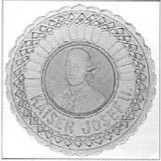
Pamětní talíř císař Josef II. (vládl 1765-1790), granulovaný nápis „KAISER JOSEF