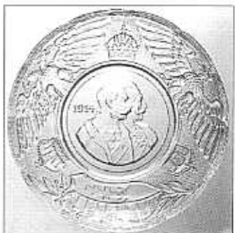
Pamětní talíř císař František Josef I. a císař Vilém II., letopočet „1914“ , 3 koruny symbolizující Rakousko, Uhersko, Německo, 2 orlí, erb, vyroben k začátku války 1914, sbírka Billek, čiré sklo, průměr 13,3 cm, dno není matované, pravděpodobně S. Reich & Co., 1914, bez značky, srv. Sellner 1986, kat. č. 166, průměr 14,8 cm, dno matované