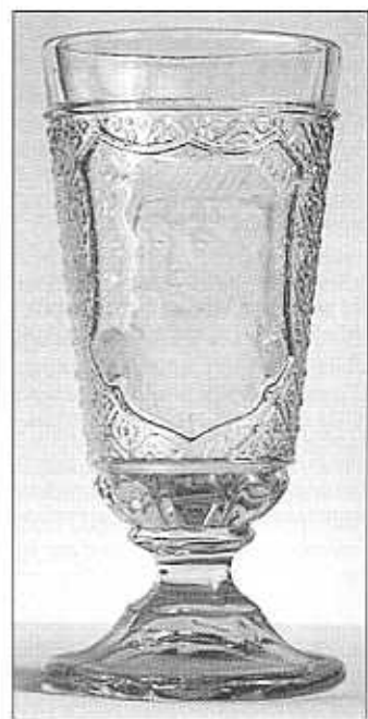
Pohár, „dívka s čepcem“ v erbu, matováno, zbytky pozlacení, čiré sklo s lehkým hnědým nádechem, výška 16,8 cm, průměr 7,8 cm, sbírka Geiselberger, pravděpodobně S. Reich & Co., okolo roku 1880, bez značky, viz Sellner 1986, kat. č. 122, pohár s divčí hlavou (šlechtična), křišťál, výška 16,7 cm, St. Louis (?), 4. čtvrtina 19. století, bez značky, sbírka Reidel