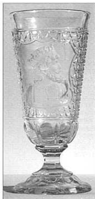
Pohár, „král Gambrinus“ v erbu, matováno, čiré sklo bez zabarvení, výška 17 cm, průměr 7,8 cm, sbírka Geiselberger a Billek, pravděpodobně S. Reich & Co., okolo roku 1880, bez značky