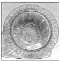
Misková část dózy

K svému velkému překvapení jsem v katalogu „České lisované sklo“ našel také misu s dělenými stěnami zdobenou dekorem „meandru a rozet“, vyrobenou pravděpodobně ve sklárnách S. Reich, Morava, 1880-1890, kterou jsem již dříve znal z knihy vzorů 1913 sklárny Hosena bratří Streitů v Berlíně. Zde byla uvedena jako miska s dekorem „Berlin“, č. 27.