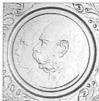
Pamětní talíř císař František Josef I. a podobizna z mládí, letopočty „1848, 1898“ , detail, sbírka Billek, čiré sklo, průměr 13,5 cm, obličej nejsou matované. (Mladý muž v pozadí je osmnáctiletý císař František Josef I. v počátcích své vlády v roce 1848.)