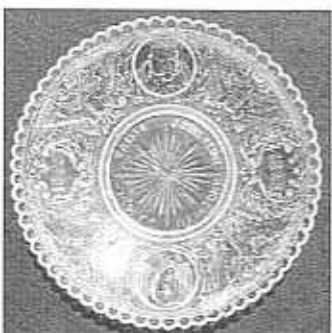
Pamětní talíř císař František Josef I. a pravděpodobně arcivévoda a korunní princ František Ferdinand, nápis „ANDENKEN a. d. 50-jähr. KAISER - JUBILAEUM“ a „1848, 1898“ (Korunní princ František Ferdinand se stal roku 1898 ve svých 35 letech oficiálním následníkem trůnu.), sbírka Stopfer, čiré sklo, průměr 14,7 cm, pravděpodobně S. Reich & Co., 1898, bez značky