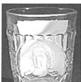
Pamětní pohár císařovna Marie Terezie, na zadní straně granulovaný nápis „MARIA THERESIA“ , sbírka Stopfer, čiré sklo, výška 7,7 cm, průměr 6,2 cm, obličej není matovaný, pravděpodobně S. Reich & Co., 1880, bez značky