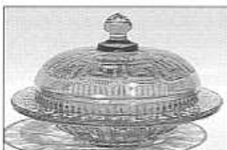
Dóza na maslo s meandry a rozetami, světlemodré sklo, výška 4 + 4,7 cm, šířka 15 cm, sbírka Geiselberger, pravděpodobně S. Reich & Co., okolo roku 1880, bez značky, velmi podobná dóze na maslo „Berlin“, č. 3469, průměr 16 cm. Kniha vzorů Streit 1913, tabulka č. 2, dózy na maslo a na sýr, světlé bílé, lisované

okolo roku 1888 a 1898. Tyto výrobky zcela jistě nebyly vyrobeny v Berlíně! Tyto sklařské výrobky musely být vyrobeny v Čechách nebo na Moravě. Teprve katalog, vydaný u příležitosti výstavy České lisované sklo, konečně přinesl spolehlivý důkaz o tom, že toto sklo pocházelo ze sklárny v Karolince nebo od firmy S. Reich. Tenkrát jsem ještě nevěděl, že tyto dva pro mě zcela rozdílné pojmy sploju souvisí.