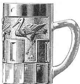
4709. Chope à Bière "Les Cigognes" Conten.. 3/10 5/10 l. Prix .. 5. » 7. »

Abb. 2004-2-01/003 Henkelbecher mit Storch farbloses Pressglas, 3/10 u. 5/10 Liter MB Markhbeinn 1933, Pl. 21, „Chopes“, Nr. 4709 MB Markhbeinn 1935, Pl. 44, Nr. 4709 wahrscheinlich S. Reich & Co. / ČMS, um 1935 vgl. Abb. 2004-1/199 Skizzenbuch Glaswerke Krásno, 31.1.1991 Pressglas für Autoscheinwerfer, darunter auch Bierkanne m. Storch, Nr. 21/0212