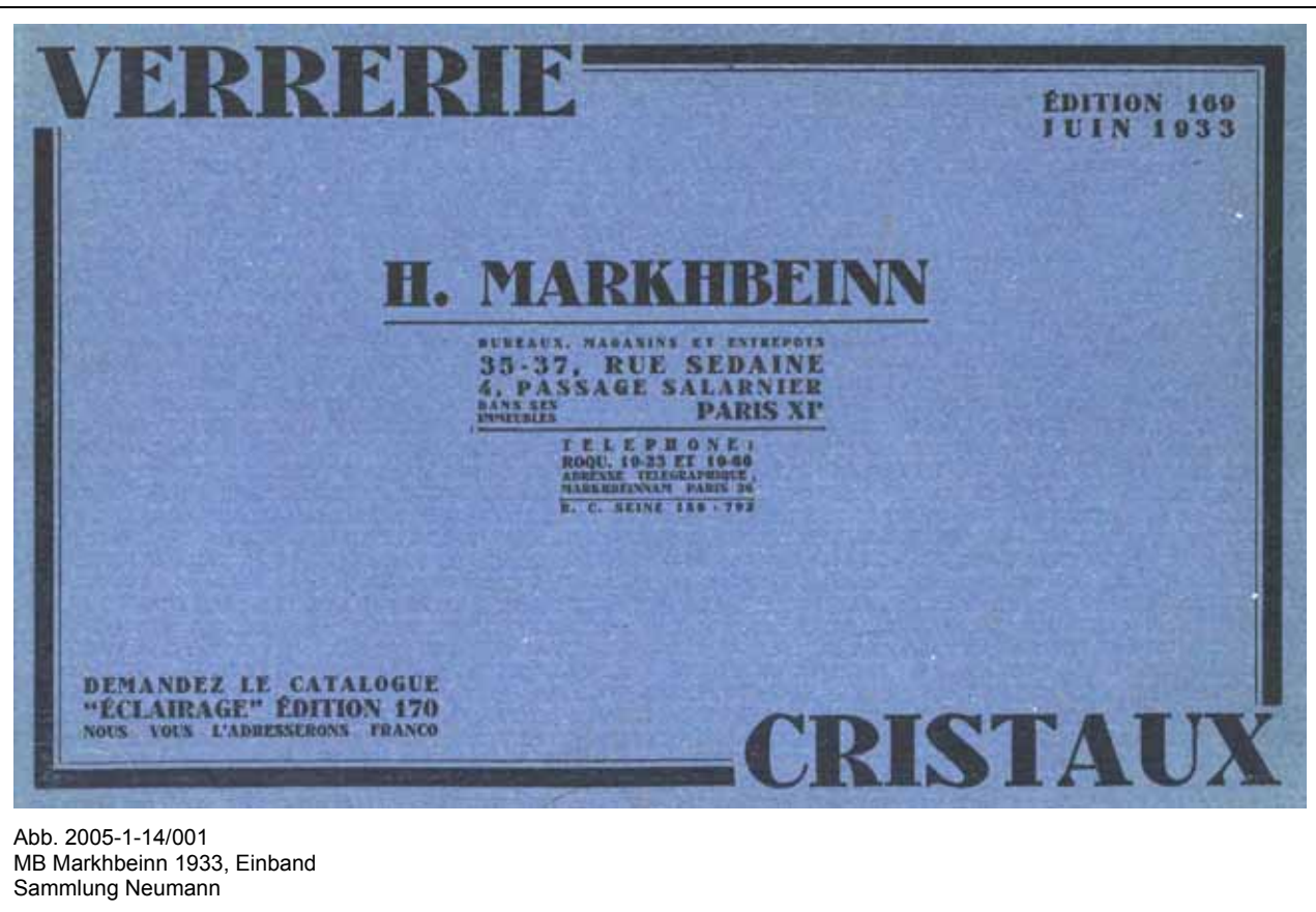
Abb. 2005-1-14/001 MB Markhbeinn 1933, Einband