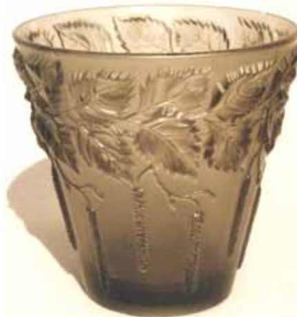
Abb. 2003-3/192 Vase mit Birkenblättern und Blütenkätzchen Sammlung Stopfer, rauchgraues Pressglas, mattiert, H 15,7 cm, D 15,7 cm vgl. MB Inwald 1934 ?, Tafel 155, Nr. 11103, Tafel 156, Nr. 11143, 11135, Tafel 157, Nr. 11149c, 11149b

Als Besonderheit werden in MB Markhbeinn 1935 „extra harte“ Pressgläser unter der Bezeichnung „Durit“ angeboten, s. Tafel 50 u. 51. Diese Gläser sind in MB Markhbeinn 1933 noch nicht aufgenommen.