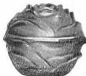
6707 Bonbonnière. Diam. 11 c/m Rosaline, Améthyste, Bleu ou Blanc mat Prix ..... 7. »

Abb. 2004-2-01/004 Bonbonniere als Rose farbloses Pressglas, mattiert, D 11 cm MB Markhbeinn 1933, Pl. 10, Nr. 6707 Réclame en Satiné, mat, Rosaline, Améthyste, Bleu MB Markhbeinn 1935, Pl. 46, Nr. 6707 S. Reich & Co. / ČMS, um 1935 s. Sammlung Stopfer, Abb. 2003-3/187 S. Reich & Co., Krásno, 1934 s. MB Reich / ČMS 1934, Tafel 74, Nr. 8751