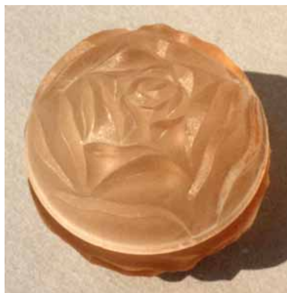
Abb. 2003-3/187 Dose mit Rosenblüte Sammlung Stopfer, rosa Pressglas, D 8 cm S. Reich & Co., Krásno, 1934 s. MB Reich / ČMS 1934, Tafel 74, Nr. 8751